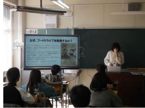
(4年生「食品ロスを学ぼう」)