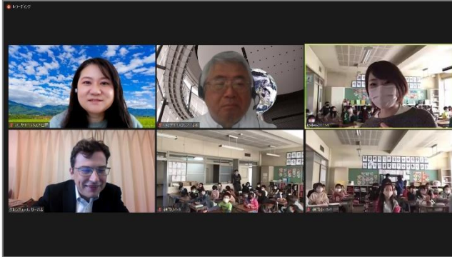
(3年生「外国の人と話そう」)