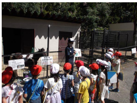
(1年生「いきものとなかよし」)