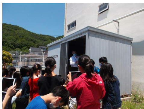
(6年生「防災倉庫」を見学)