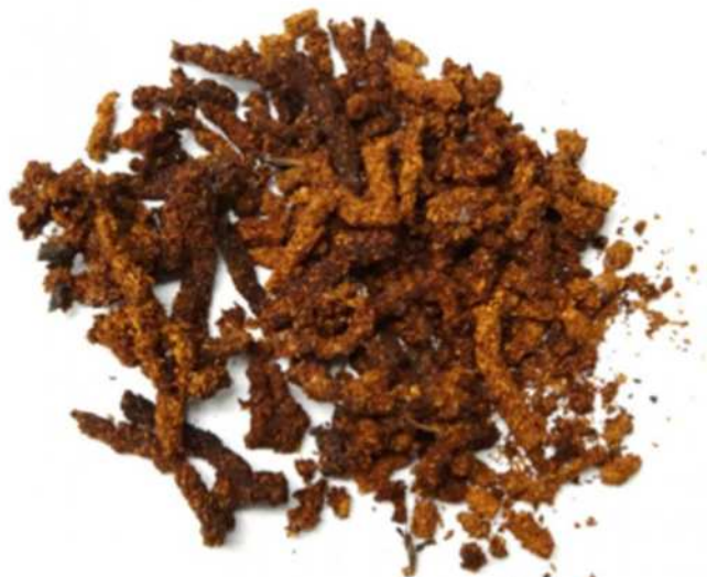
クビアカツヤカミキリのフラス