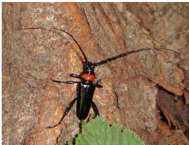
クビアカツヤカミキリ（成虫）

大阪府と連携して調査した結果、池田市域への侵入は確認されませんでした。引き続き大阪府と連携しながら調査していきます。