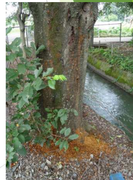
サクラの根元に散乱したフラス