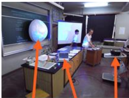
半球スクリーン（風船式） パソコン PCプロジェクター